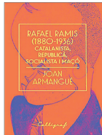
La portada del llibre.

Exiliat a París, durant la dictadura de Primo de Rivera, «es va convertir en home de confiança de Francesc